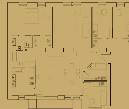
pôdorys po rekonštrukcii